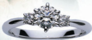
＜ミキモト＞ブライダルコレクション