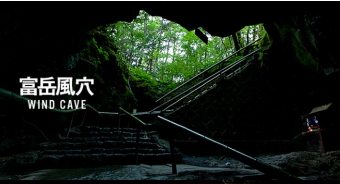
富岳風穴 WIND CAVE

「富岳風穴」と「鳴沢氷穴」の洞窟内気温は真夏でも 0°C～3°C ！ 真夏でも 氷柱 をご覧いただけるので、見て、感じて、涼しい観光スポットです。