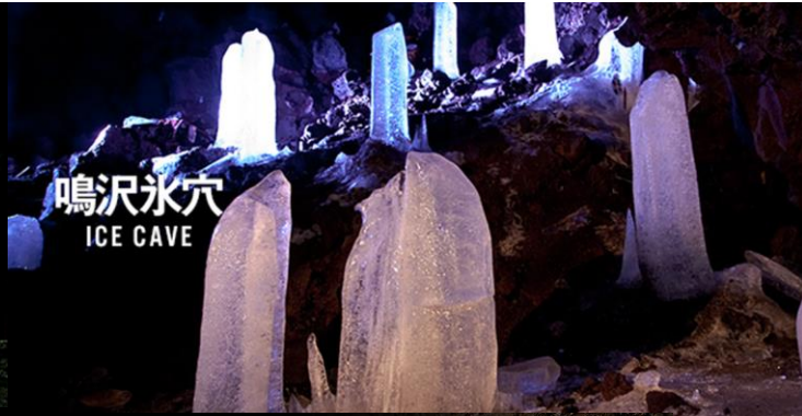
鳴沢氷穴 ICE CAVE